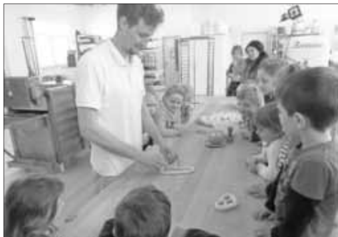
Besuch beim Bäcker-Einblick in die Backstube

Der Kindergarten Kaltental hat mitgemacht bei „ICH KANN KOCHEN.“ Dies ist eine Kooperation der Sarah Wiener Stiftung & Barmer Krankenkasse. Das gemeinsame Ziel ist dabei, die Kinder für ausgewogene & frische Ernährung zu begeistern, die Neugier auf frische Lebensmittel zu wecken und selbstgekochtes Essen zu genießen. Derzeit ist dies in Deutschland die größte Initiative für praktische Ernährungsbildung für Kita- und Grundschulkinder. Hierfür waren die Teilnahme an einer Fortbildung sowie eine Projektdokumentation die Voraussetzung. Der Kindergarten Kaltental erhält 400 € zum Lebensmitteleinkauf , um damit gemeinsam mit den Kindern kochen zu können. Gestartet hat der Kindergarten das Projekt mit einem Einkauf auf dem Wochenmarkt und anschließendem Besuch in der Backstube der Bäckerei Dolp. Regelmäßig wird gebacken und gekocht, um die Alltagskompetenzen der Kinder zu erweitern.