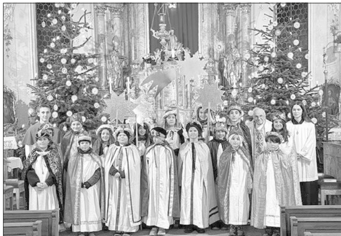
Ihr Pfarrgemeinderat Osterzell

Wie jedes Jahr zogen auch heuer die Sternsinger umher und brachten den Häusern Christus Segen. Unter dem Motto „Gemeinsam für unsere Erde – in Amazonien und weltweit“ stehen die Bewahrung der Schöpfung und der respektvolle Umgang mit Mensch und Natur im Fokus der Aktion 2024. Daher herzlichen Dank an die Sternsinger und an alle, für die großzügige Spendenbereitschaft.