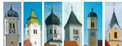
St. Andreas, St. Gordian u. Epimach, St. Laurentius u. Agatha, St. Stephan, St. Vitus, St. Peter u. Paul

Kath. Pfarrkirchenstiftung St. Laurentius u. Agatha Frankenhofen