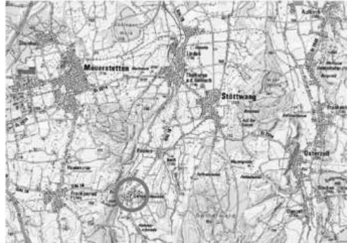
Topographische Karte maßstabslos, geoportal.bayern.de © 2023 Bayerische Vermessungsverwaltung, EuroGeographics