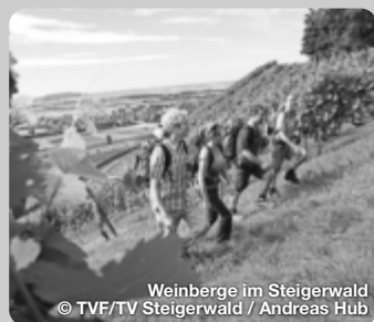
Weinberge im Steigerwald