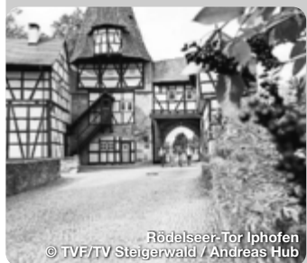
Rödelseer-Tor Iphofen

Der Steigerwald ist eine Region, die mit ihrer Vielfalt überrascht: Alte Wälder, sonnige Weinberge, historische Städtchen, male- rische Dörfer, Flüsse und Teiche, Höhen und Weite. Eine Natur, die anregt zum Haltmachen, zum Genießen, zum Erleben. Hier treffen Sie auf Buchenwälder, die in ihrer Art und Ursprünglich- keit einmalig in ganz Deutschland sind. Hier wird deutlich, was Kulturlandschaft bedeutet: Erbe, das bereichert, Gegenwart, die verzaubert. Zeit für die fränkische Vielfalt - landschaftlich, kulturell und nicht zuletzt kulinarisch bietet der Steigerwald eine einzigartige Vielfalt – ob im goldenen Herbst, in der Winterzeit bei traumhaften Weihnachtsmärkten oder beim Frühlingserwa- chen. TreffpunktDeutschland.de/steigerwald