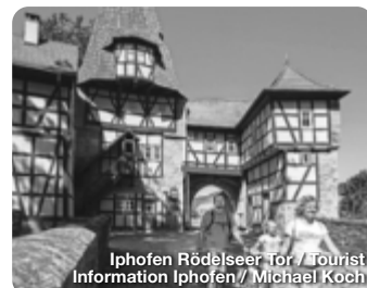
Iphofen Rödelseer Tor / Tourist Information Iphofen // Michael Koch

Ein Rundgang durch das Fränkische Freilandmuseum ist wie eine Zeitreise durch 700 Jahre fränkische Alltags- geschichte: Über 100 Gebäu- de, Bauernhöfe, Handwerker- häuser, Mühlen, Schäfereien, Brauereien, Amtshaus, Schul- haus und Adelsschlösschen, Scheunen, Ställe, Back- und Dörrhäuschen laden ein zur Entdeckungsreise in die Ver- gangenheit. Sie vermitteln, wie die ländliche Bevölkerung in Franken früher gebaut, ge- wohnt und gearbeitet hat. Erkenbrechtallee 1, Bad Windsheim