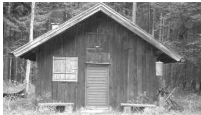
Die Reischberghütte im Denklinger Rotwald, südlich von Dienhausen, auf der Reischberg-Anhöhe (789 m)