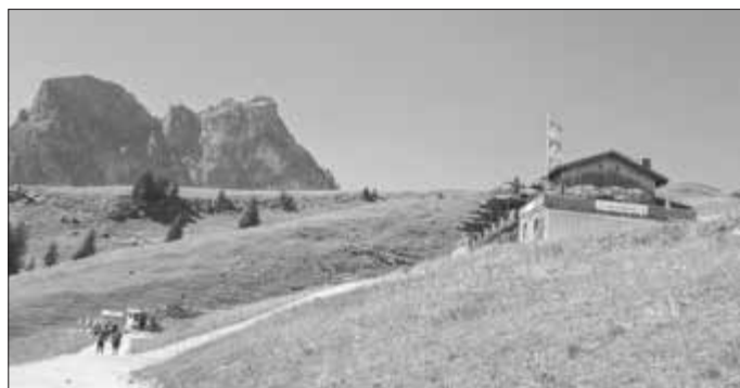
Die traditionelle Bergmesse des Landvolks findet heuer am Breitenberg bei Pfronten statt.