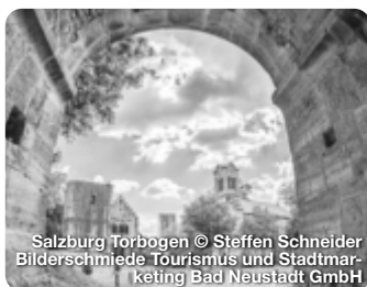
Salzburg Torbogen