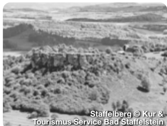
Staffelberg © Kur &amp; Tourismus Service Bad Staffelstein