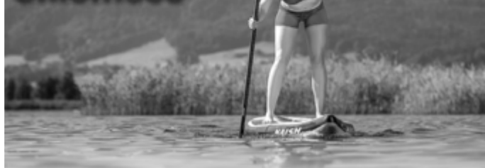
Bootswandern auf der Donau, Kanuerlebnisse Hanika