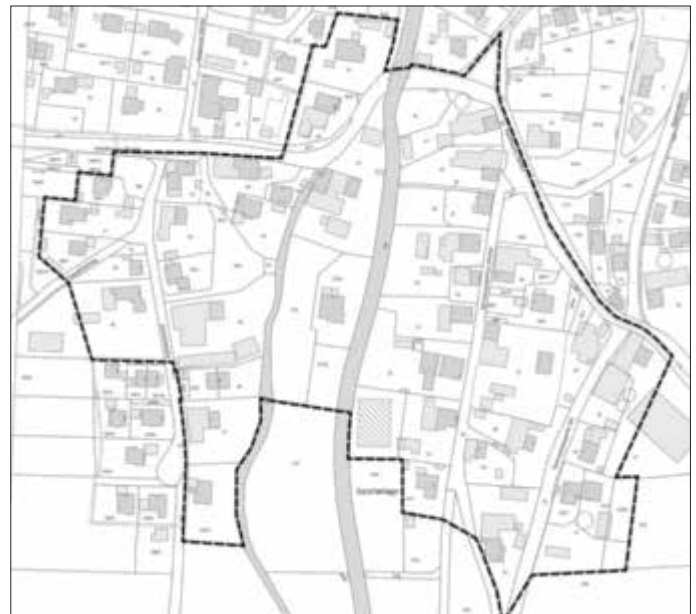
Abbildung 1: Lageplan des Geltungsbereiches des gegenständlichen Bebauungsplanes, unmaßstäblich

Im Einzelnen gilt der Lageplan vom 01.06.2022. Der Lageplan ist im folgenden Kartenausschnitt dargestellt: