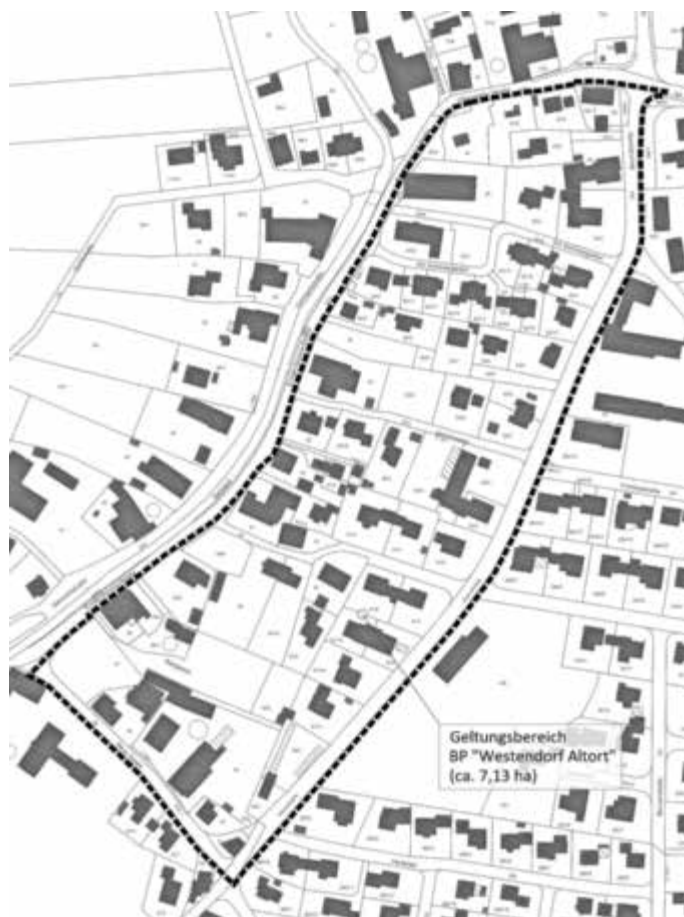
Abbildung 1: Abgrenzung Geltungsbereich; (nichtmaßstäblicher Lageplan)

Die Verarbeitung personenbezogener Daten erfolgt auf der Grundlage der Art. 6 Abs. 1 Buchstabe e (DSGVO) i. V. mit § 3 BauGB und dem BayDSG. Sofern Sie Ihre Stellungnahme ohne Absenderangaben abgeben, erhalten Sie keine Mitteilung über das Ergebnis der Prüfung.