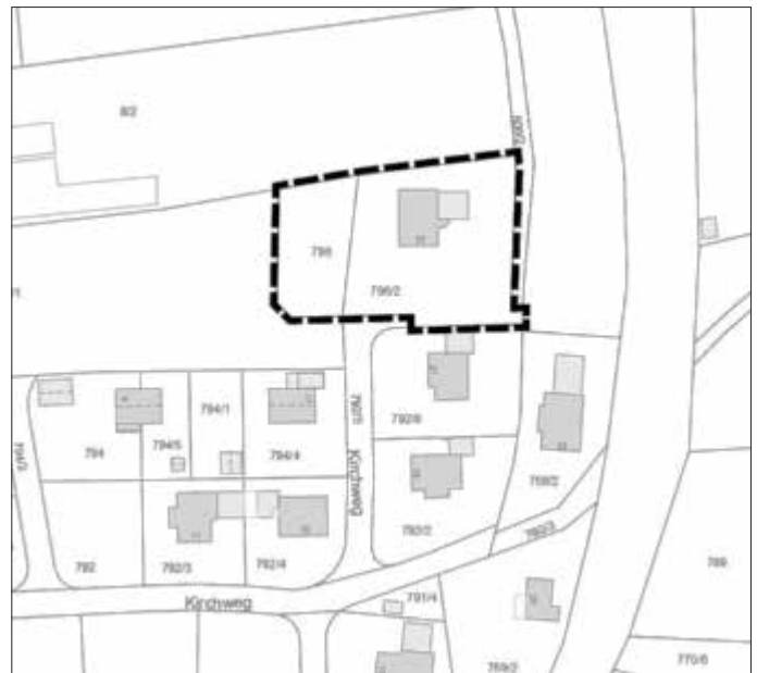
Abbildung 1: Lageplan des Geltungsbereiches des gegenständlichen Bebauungsplanes, unmaßstäblich

Im Einzelnen gilt der Lageplan vom 19.10.2021. Der Lageplan ist im folgenden Kartenausschnitt dargestellt: