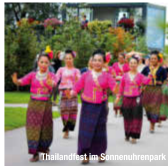
Thailandfest im Sonnenuhrenpark