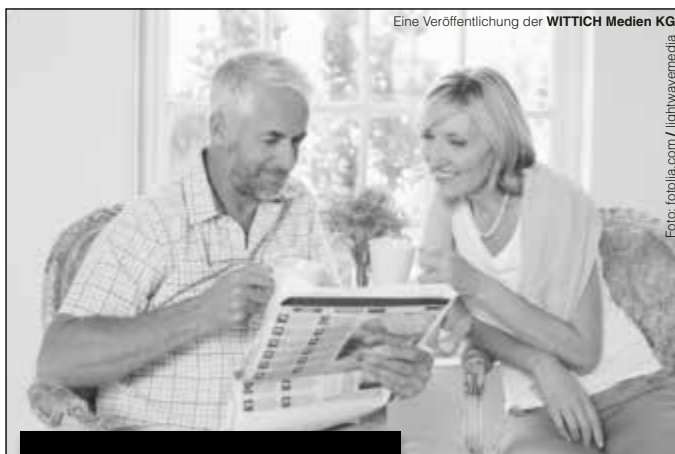
Eine Veröffentlichung der WITTICH Medien KG

Lokal informiert. Druck. Internet. Mobil.