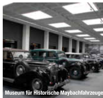
Museum für Historische Maybachfahrzeuge

Fränkische Dreiflüssestadt – so kennen die meisten Gemüden. Sinn und Fränkische Saale münden hier in den Main. Im Stadtteil Wernfeld fließt noch ein vierter Fluss – die Wern – in den Main, so dass auch von der Vierflüssestadt gesprochen wird. treffpunktdeutschland.de/gemuenden