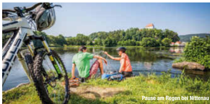
Pause am Regen bei Nittenau