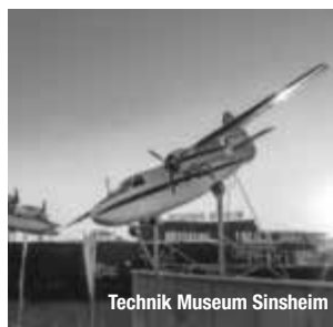
Technik Museum Sinsheim