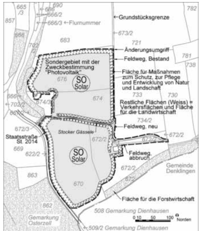
Abbildung: Lageplan, unmaßstäblich Osterzell, den 25.06.2021

Entwurfsunterlagen der Flächennutzungsplan-Änderung sind außerdem im Internet auf der Homepage unter „https://www.osterzell.de/baugebiete.html“ eingestellt und können dort eingesehen bzw. abgerufen werden.