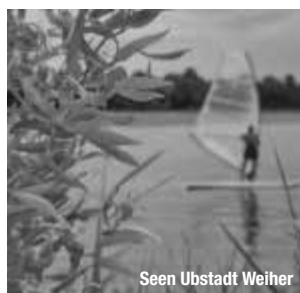
Seen Ubstadt Weiher

treffpunktDeutschland.de/kraichgau-stromberg